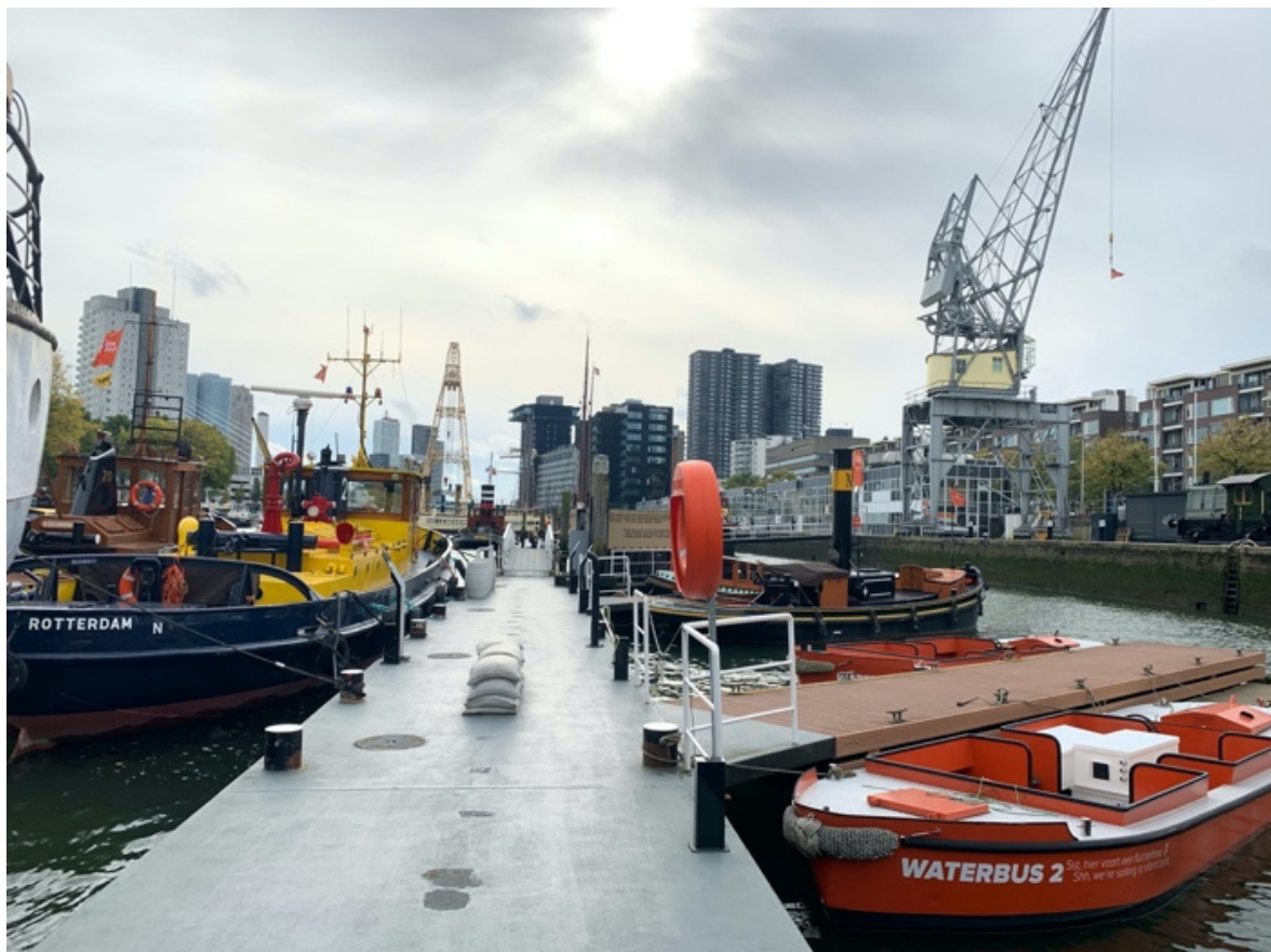
A Maritime Museum (Tengerészeti Múzeum) látványkikötője

A meglehetősen nagy mennyiségű szakirodalom okán kezdetben sok időt töltöttem az órákra való készüléssel, amíg ki nem tapasztaltam hogyan tudom hatékonyabban feldolgozni az anyagot. A jobban beosztott időnek hála többet tudtam utazni, így eljutottam Hágába, Utrechtbe, Amszterdamba, Tilburgba és Eindhovenbe.