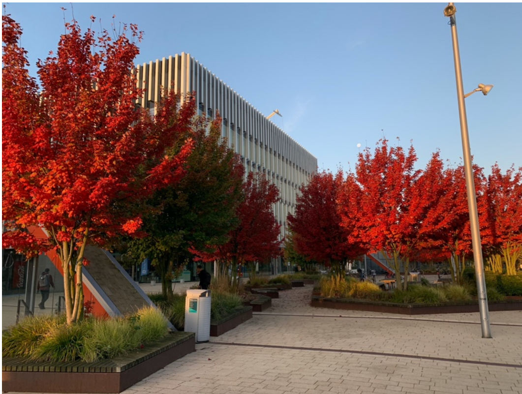
Polak Building ősszel, a kedvenc épületem a Campuson

Maga a Campus viszonylag közel helyezkedik el a városközponthoz. Én körülbelül 35-40 percet töltöttem utazással reggelente, mivel a város déli részén laktam, de ez egyáltalán nem volt megterhelő. Általában minden reggel vettem egy kávé a Campuson található SPAR-ban az óráim előtt.