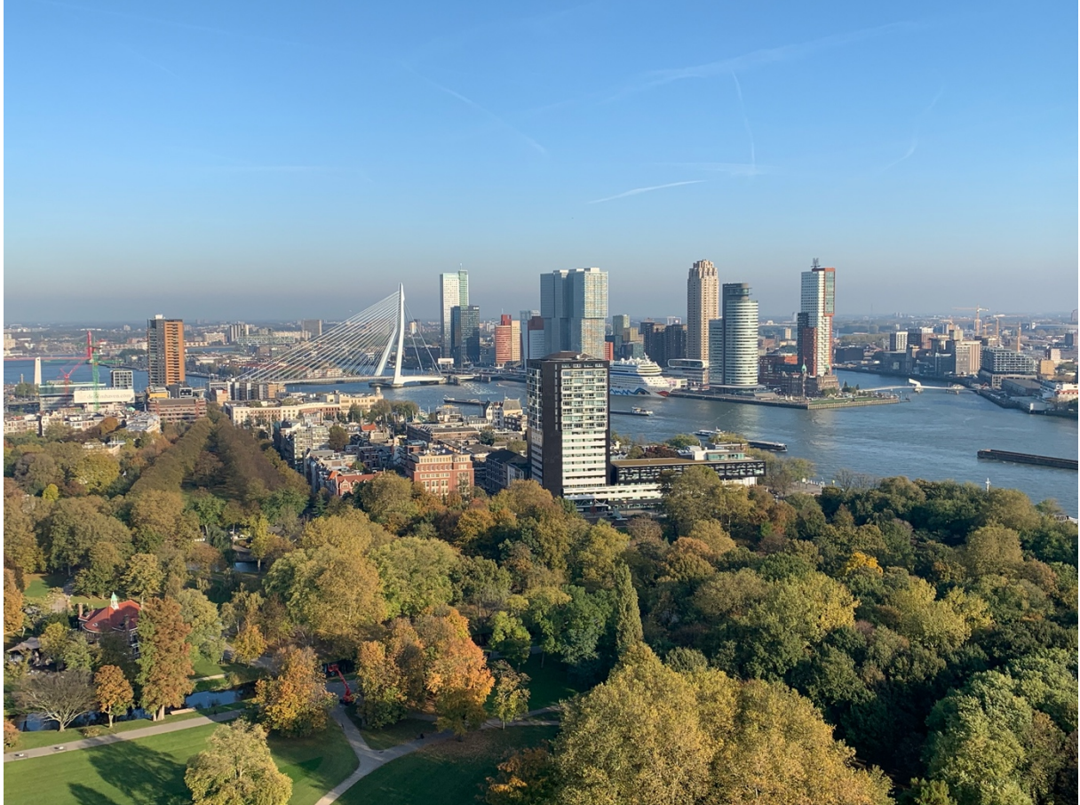
Rotterdam madártávlatból, háttérben az Erasmus Bridge

A 2019/2020-as tanév őszi szemeszterét Hollandiában, azon belül Rotterdamban az Erasmus University Rotterdam-on volt szerencsém eltölteni az Erasmus+ program keretein belül. Ebben a dokumentumban a tapasztalataimat, élményeimet szeretném megosztani a jövő kiutazóival, illetve azokkal, akik gondolkoznak egy esetleges pályázaton, de még nem döntötték el, hogy bele mernek-e vágni az „Erasmus-kalandba”.