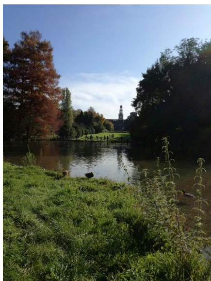
Parco Sempione és a vár

Milánóban a modern építészet is térnyerést kap. Egy egyetemi túra keretében meglátogattam a Villa Necchi Campigliót, amely egy modern, huszadik századi, racionalista kastély gyönyörű kerttel. Mivel Milánó az üzleti központ Olaszországban, itt található a Tőzsde is, amelyet érdemes legalább kívülről megnézni. Az egyik kedvenc helyem a városban a Garibaldi vasútállomás környéke, amely helyet ad a város legmagasabb épületének, az Unicredit palotának és mellette a Bosco Verticale (=függőleges erdő) lakóházaknak, amelyek teraszai tele vannak fákkal. Ezek mellett található a Palazzo Lombardia, Milánó 2. legmagasabb épülete, amely legfelső szintjére hétvégénként ingyenesen fel lehet menni és tiszta időben látni lehet az egész várost, sőt az Alpokat is. Ha egy kis csendre és zöld környezetre vágytam, akkor a milánói parkok valamelyikét látogattam meg, a kedvenceim a Giardini Pubblici és a Parco Sempione voltak, utóbbi mellett található Milánó vára is a Castello Sforzesco. Mindkét hely könnyen elérhető metróval egy séta erejéig.