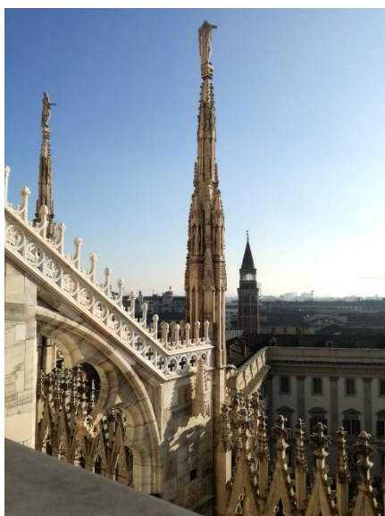
Kilátás a Duomo tetőről