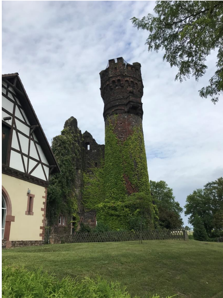
Schloss campus kívülről

Én Campus Mundi ösztöndíjjal vettem részt a programban, amivel tényleg azt mondhatom, hogy pénzügyileg nem megterhelő időszakon vagyok túl. A pályázat célja, hogy a hallgatók a külföldi egyetemen teljesített tanulmányai alatt az itthoni tanulmányaihoz szorosan kötődő kurzusokat teljesítsenek, és interkulturális tapasztalatokat szerezzenek, melyek hazatérésüket követően a magyar munkaerőpiacon való elhelyezkedésben vagy további tanulmányaihoz előnyt biztosítanak.