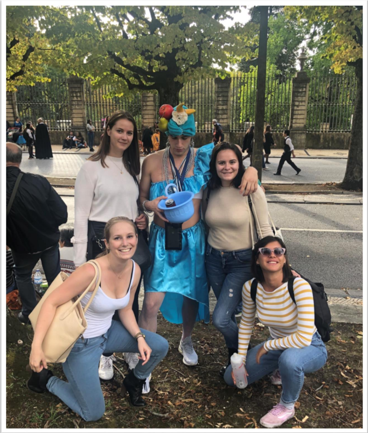
Coimbra - Latada Festival (Okt)