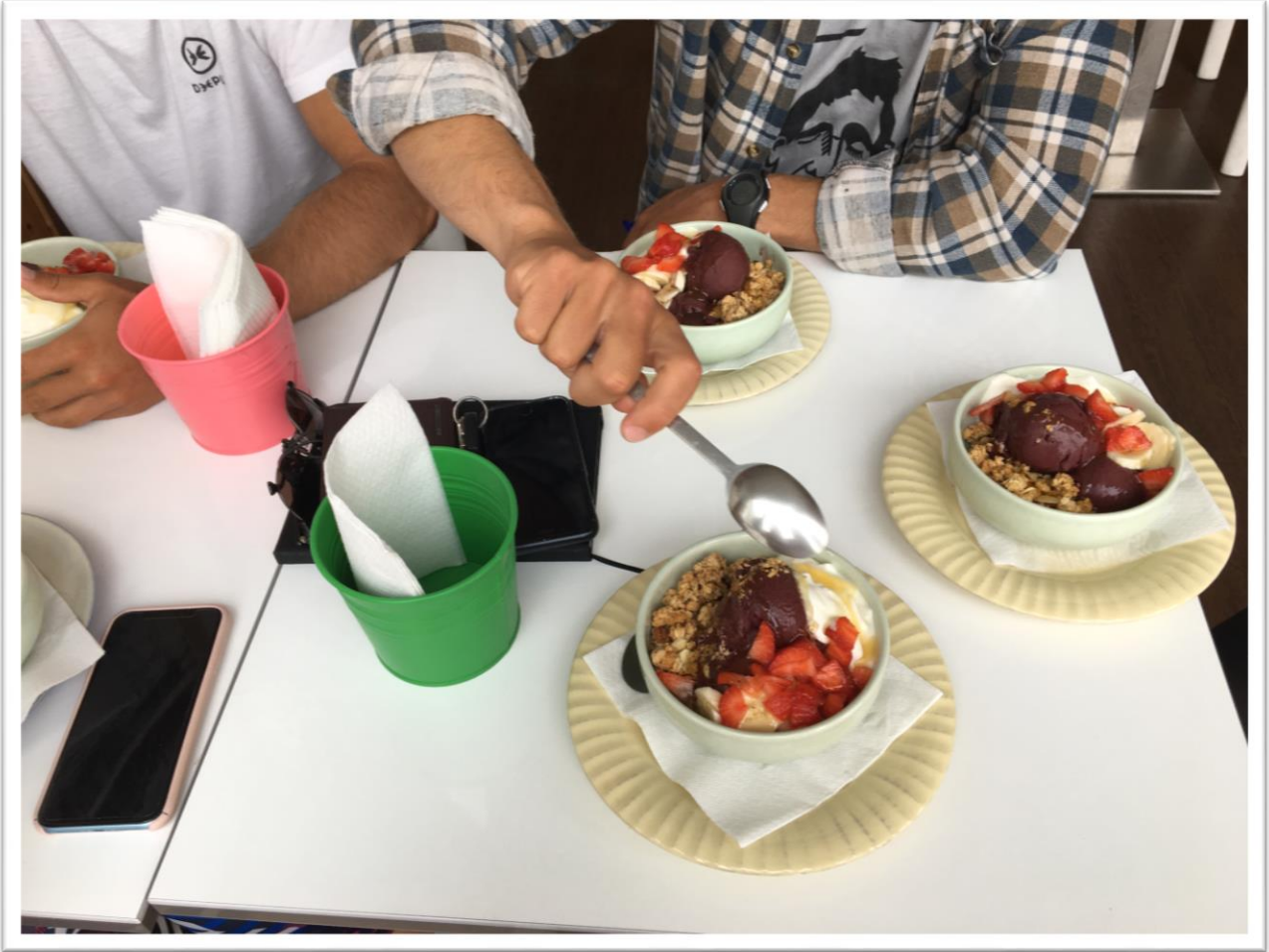
Szörf utáni rituálé – Acai bowl