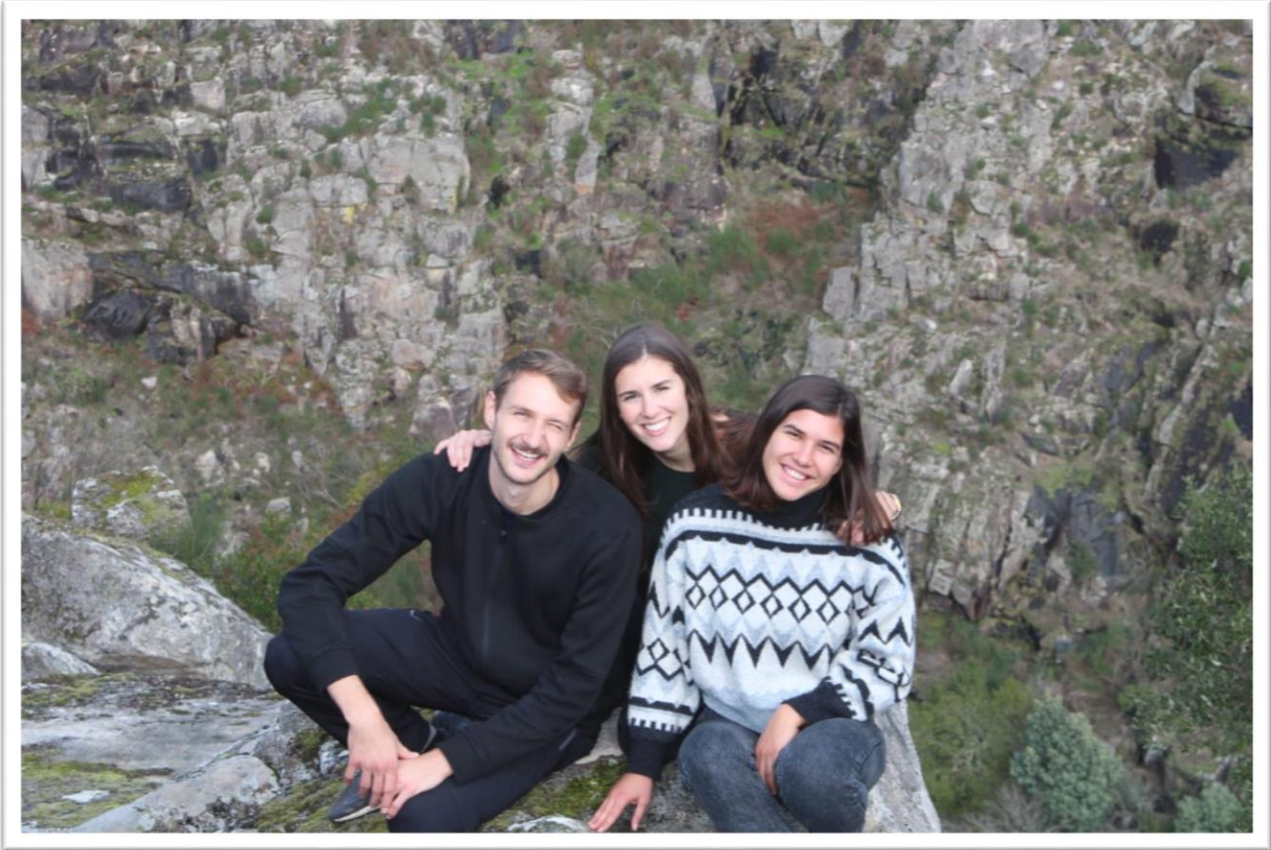
Paiva túra (Nov)