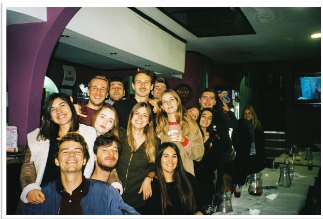
2 nd home karácsonyi vacsora (Dec)