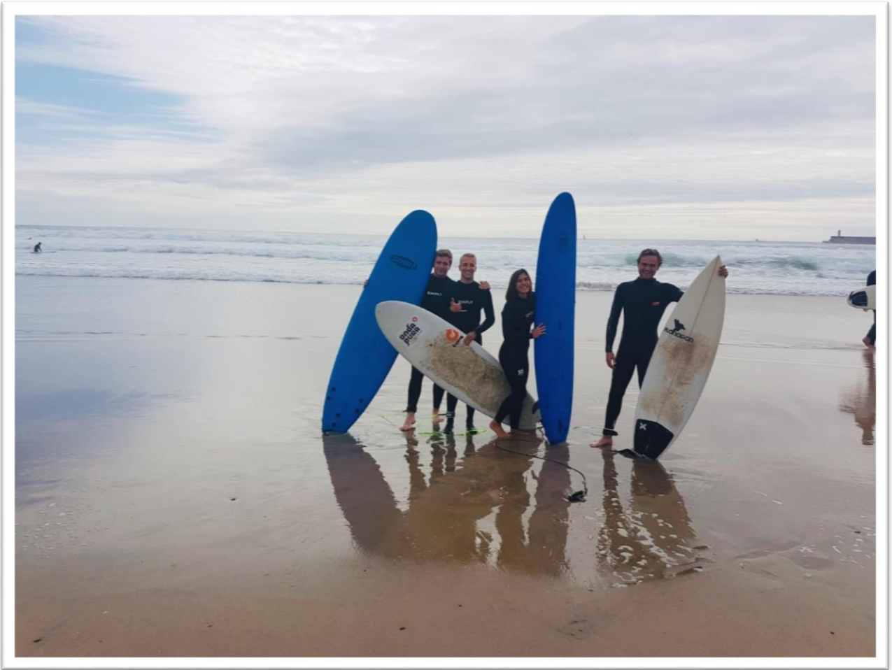
Szörf télen – Matosinhos (Dec)