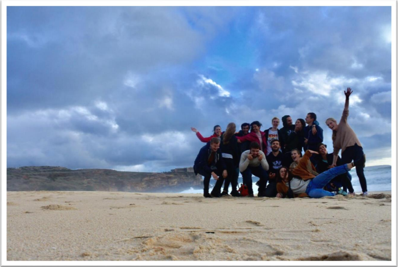
Nazare kirándulás (Nov)