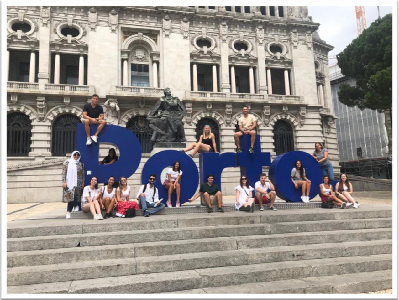
2 nd home városnézés (Szept)