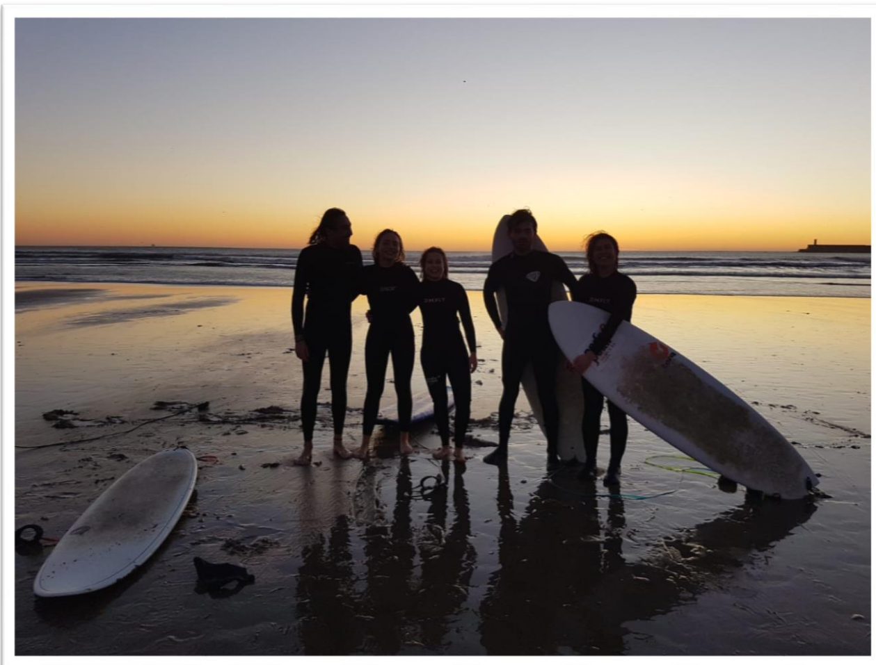
Szörf a naplementében – Matosinhos (Jan)