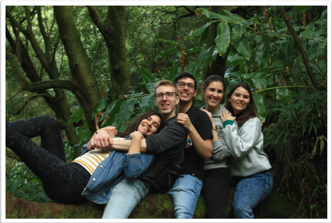
Azori-szigetek (Sao Miguel) – dzsungel (Jan)