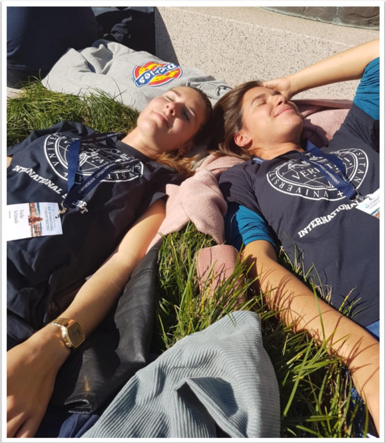
International Student Day – Lisbon (Okt)