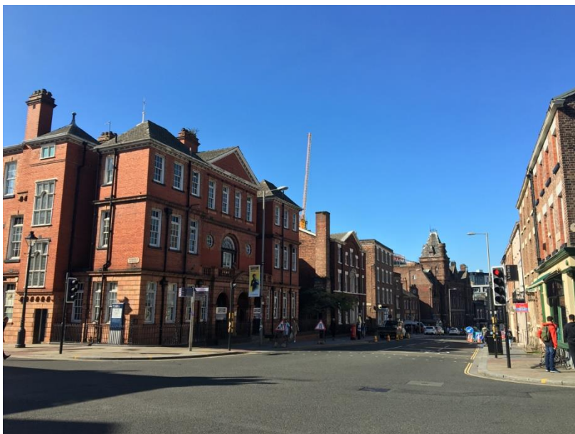
Első nap Liverpoolban