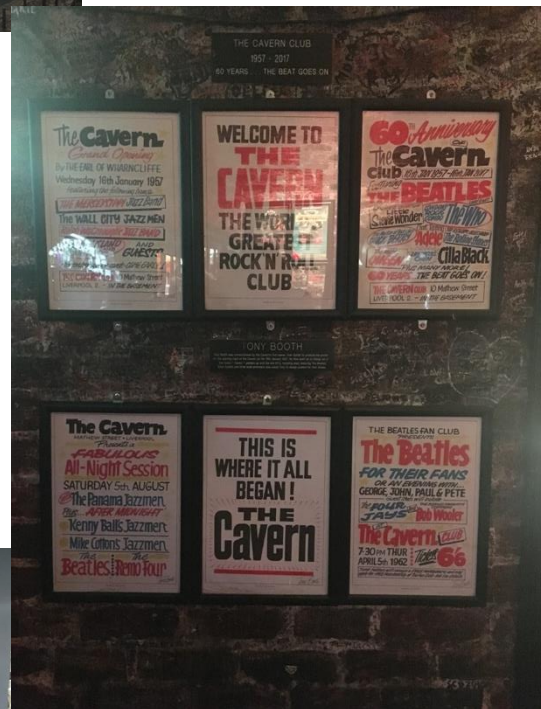
A híres Cavern Club