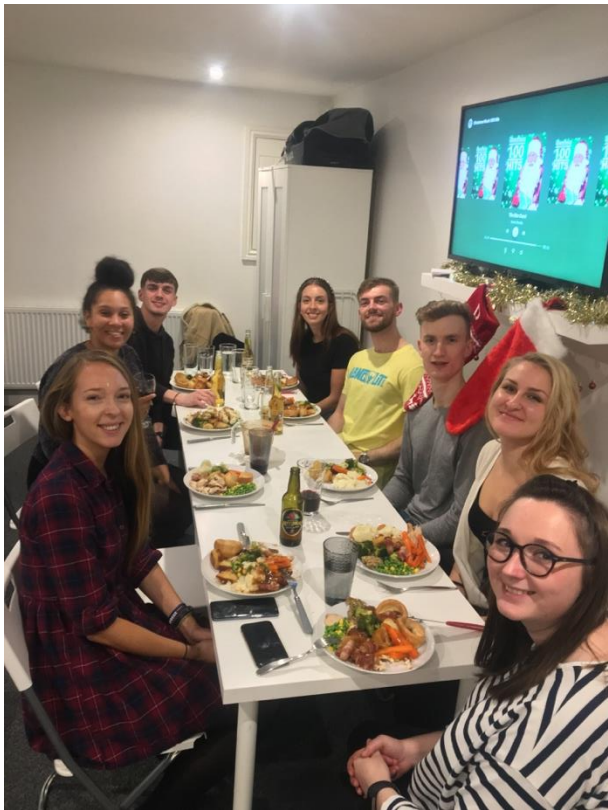
Karácsonyi vacsora a kollégáimmal nálunk