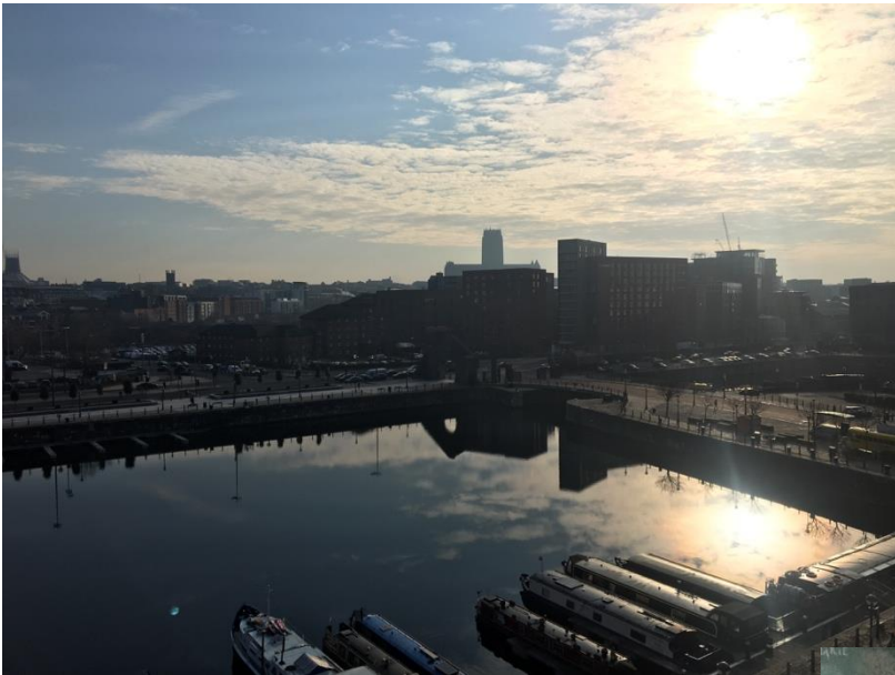
Kilátás az irodából