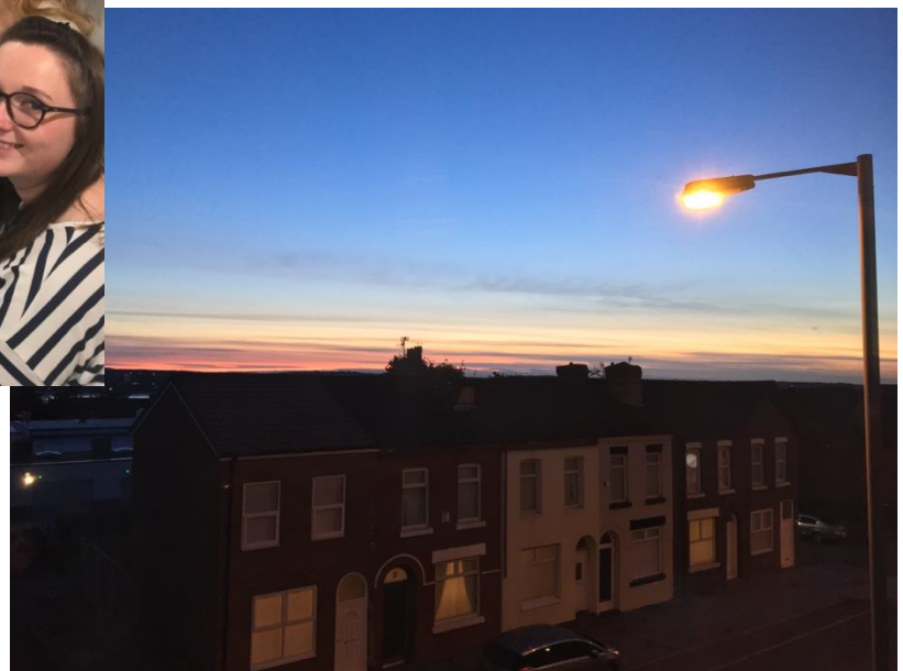
Kilátás a szobából