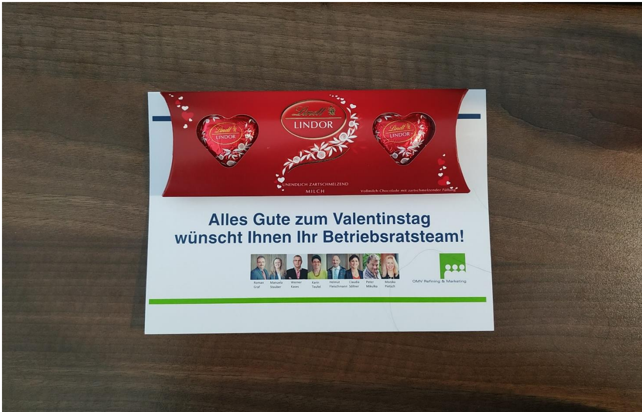
Valentinnapi meglepetés az OMV-től.