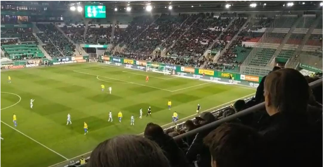
Egy focimeccsen, amit az OMV is támogatott, és lehetett rá támogatói jegyet nyerni