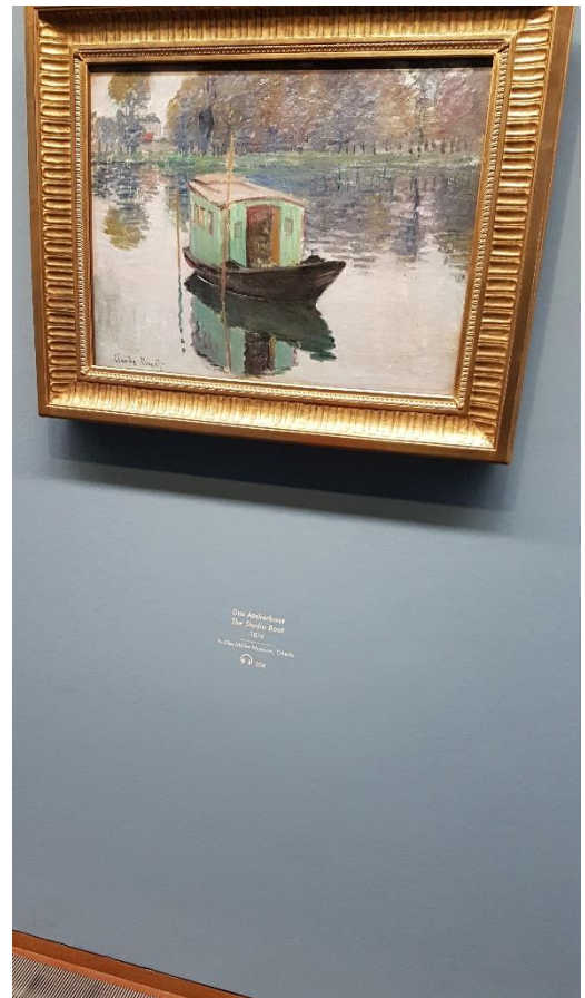
Monet- kiállítás az Albertina múzeumban