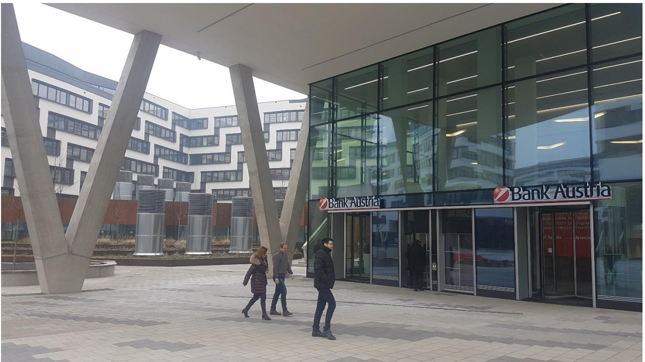
A 2018 első felében átadott lakó- és üzleti negyed, az Austria Campus Bécs 2. kerületében, itt található az UniCredit Bank Austria központja