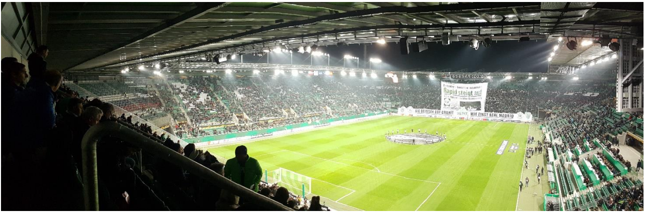
A Rapid Wien mérkőzései kiváló hangulatban zajlanak