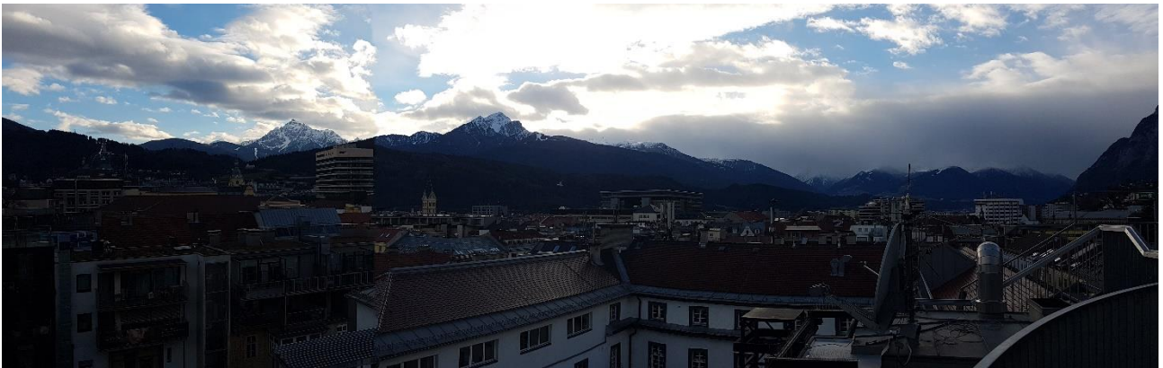
Innsbruck a hegyek ölelésében