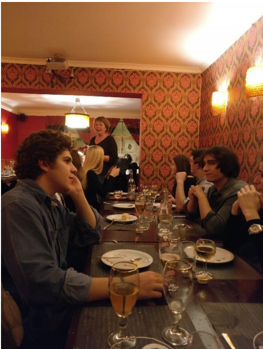
Karácsonyi vacsora a diákokkal