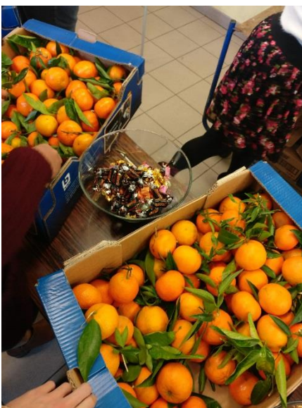
Jött a Mikulás (december 6-án!)