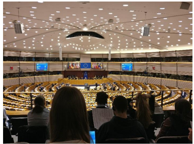
EU Parlament Brüsszelben