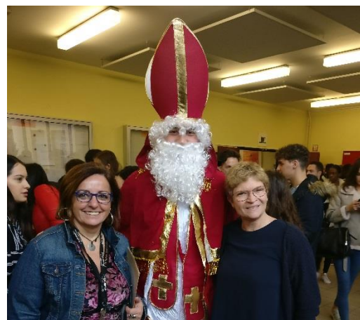
HÖK elnök és a kollégáim