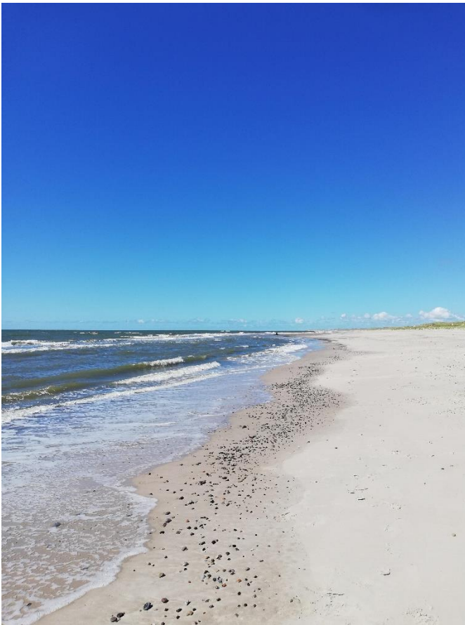
Dán tengerpart nyáron.