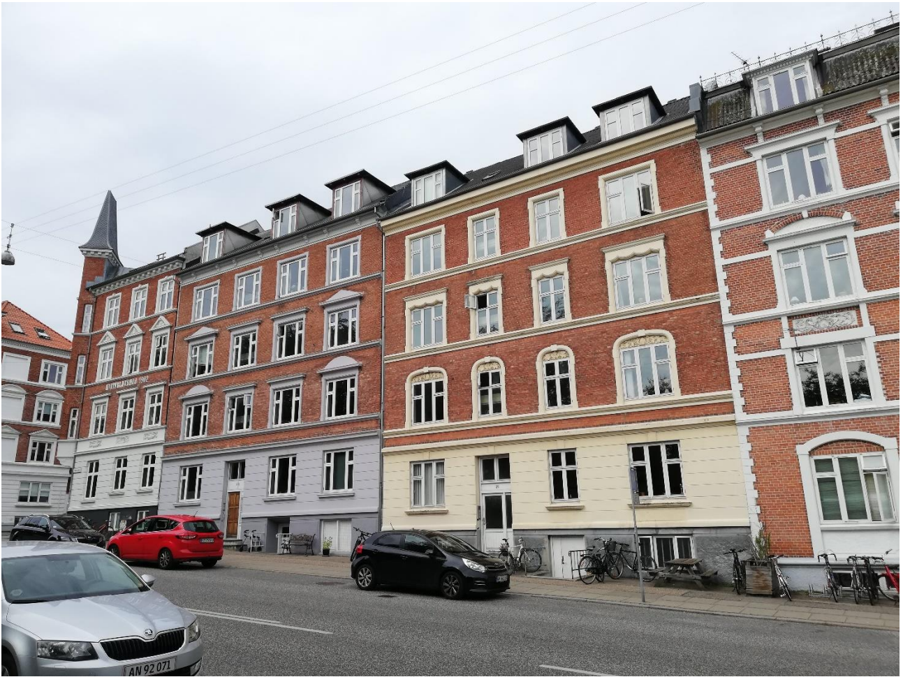
A Dániára nagyon jellemző vörös téglás épületek.