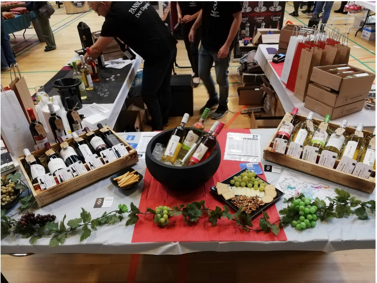
Első sales élményem – borkiállításon jártam a fogadó szervezetemmel.