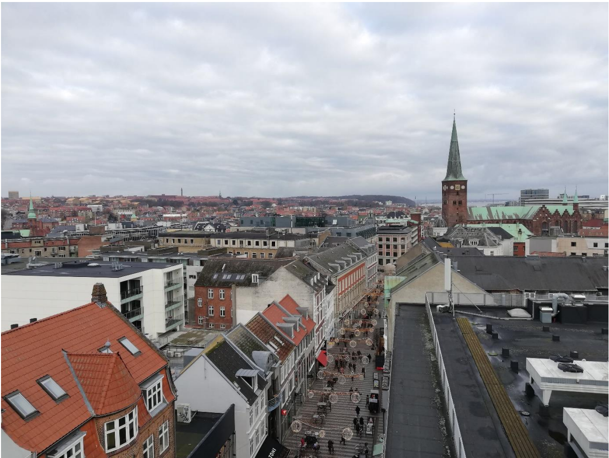
Kilátás Aarhusra az ingyenes látogatható Salling tetőteraszról.