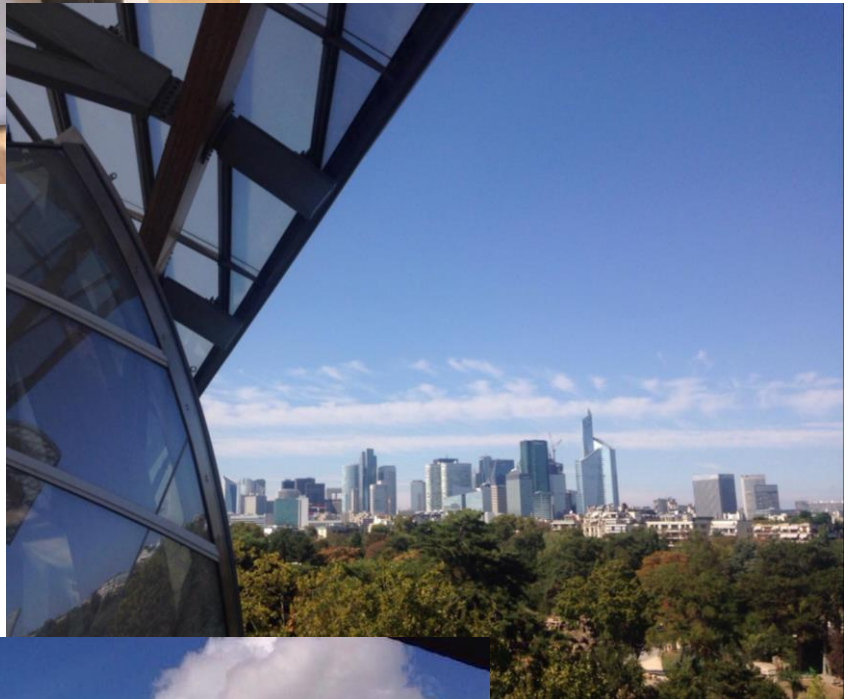
La Defense (köztük az Egee tour, ahol dolgoztam) a Louis Vuitton Foundation épületéből fotózva