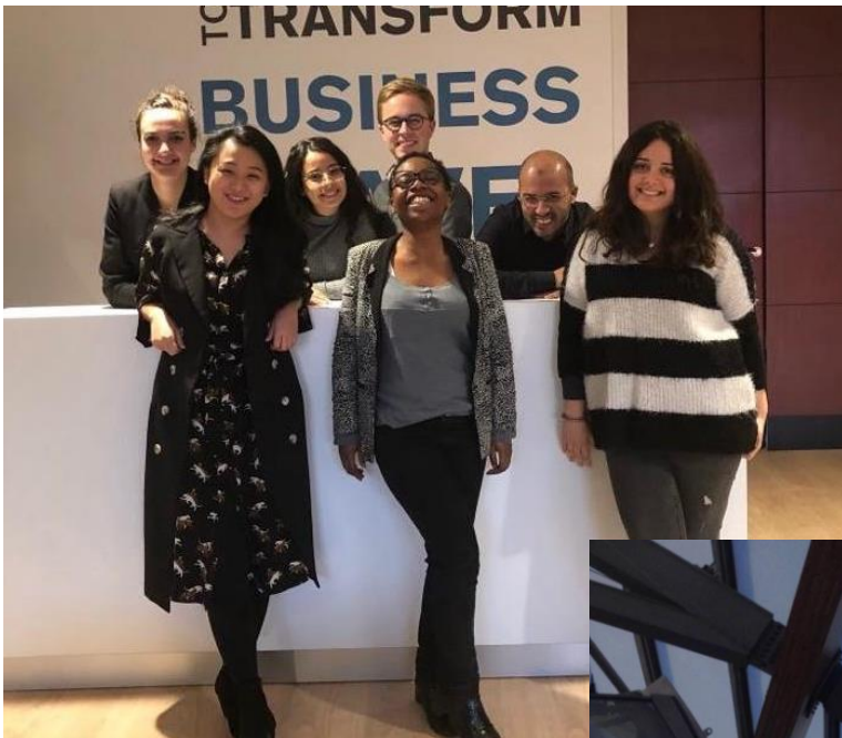
Munkahelyi kis csapatom