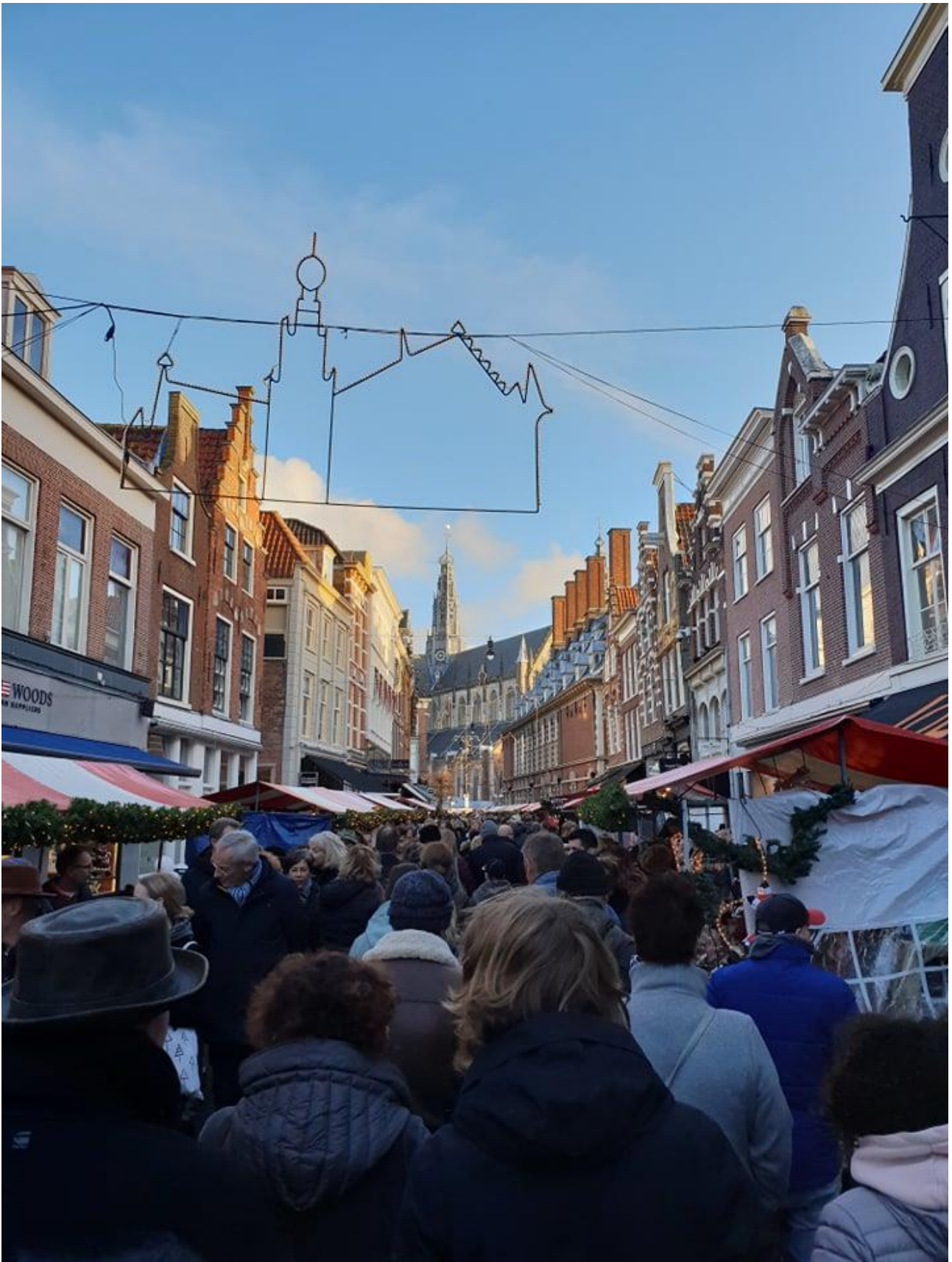
Karácsonyi vásár Haarlemben. Mindig óriási a tömeg, hiszen csak egy hétvégén van nyitva, és a város kicsit olyan ilyenkor, mint egy mézeskalács falu.