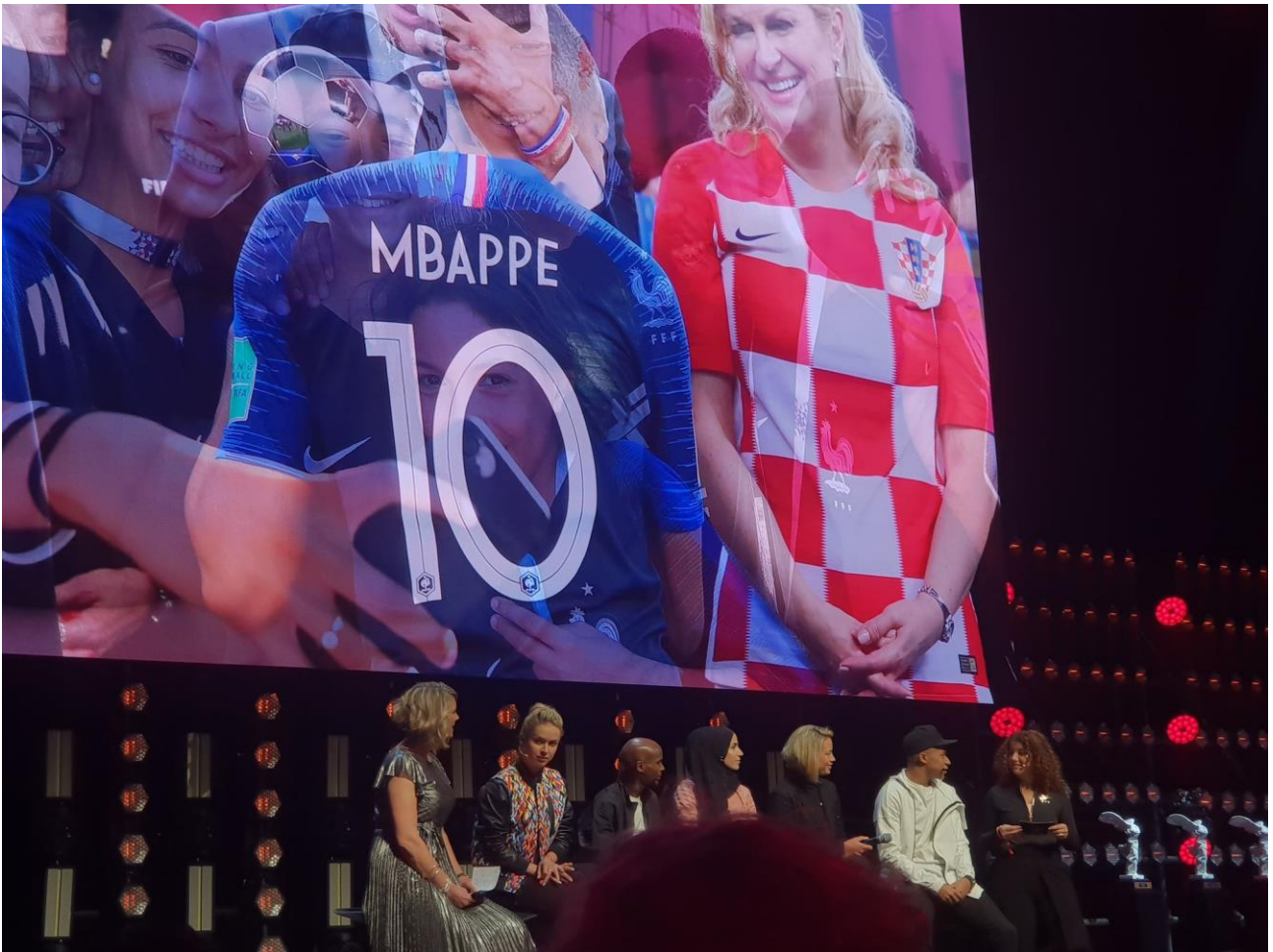
Nike INC. Karácsonyi buli: híres sportolókat hívtak meg egy kerekasztal beszélgetésre. Mo Farah és Mbappe is részt vett a bulin. 😊