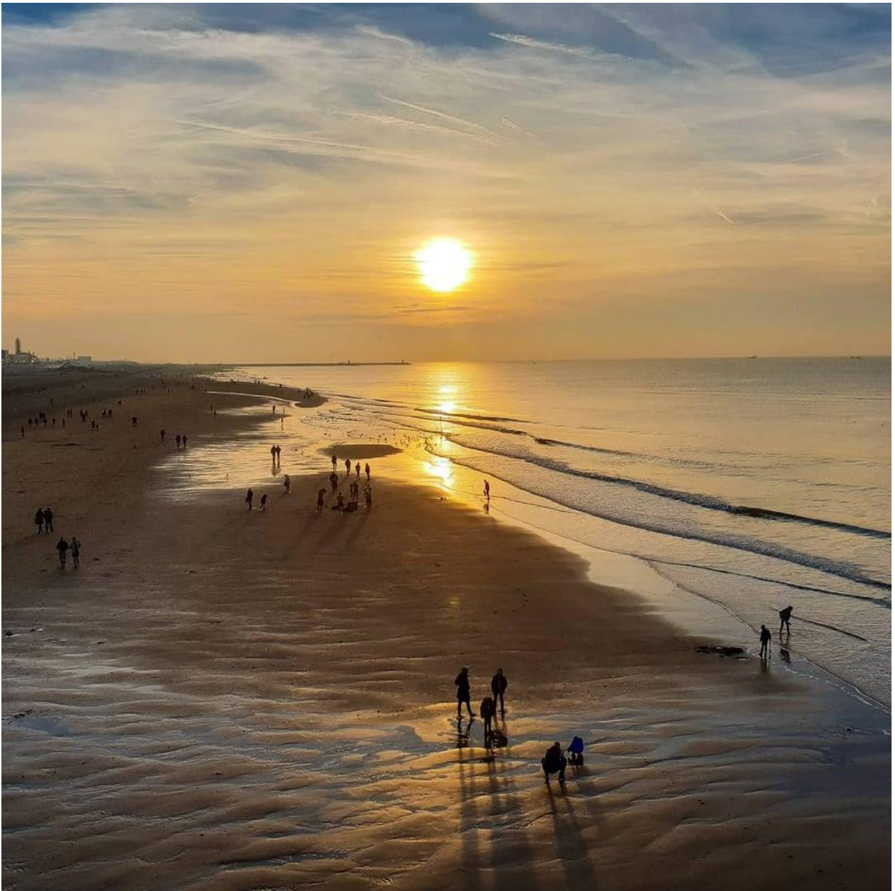
Hága tengerpartja. A naplementék gyönyörűek!