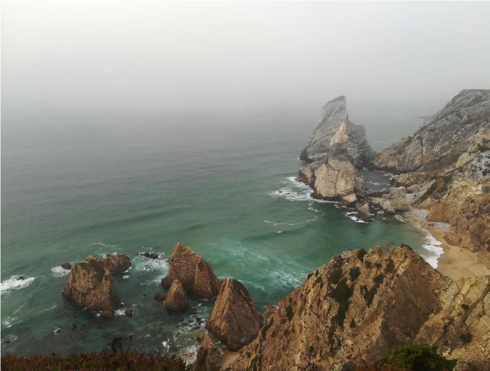
Praia da Ursa (Cabo da Rocha mellett)