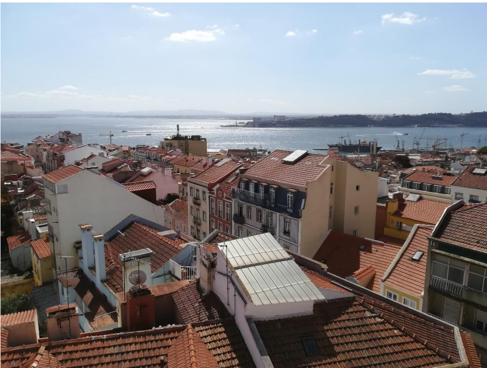
Lisszaboni kilátás az egyik vendégházunk tetejéről