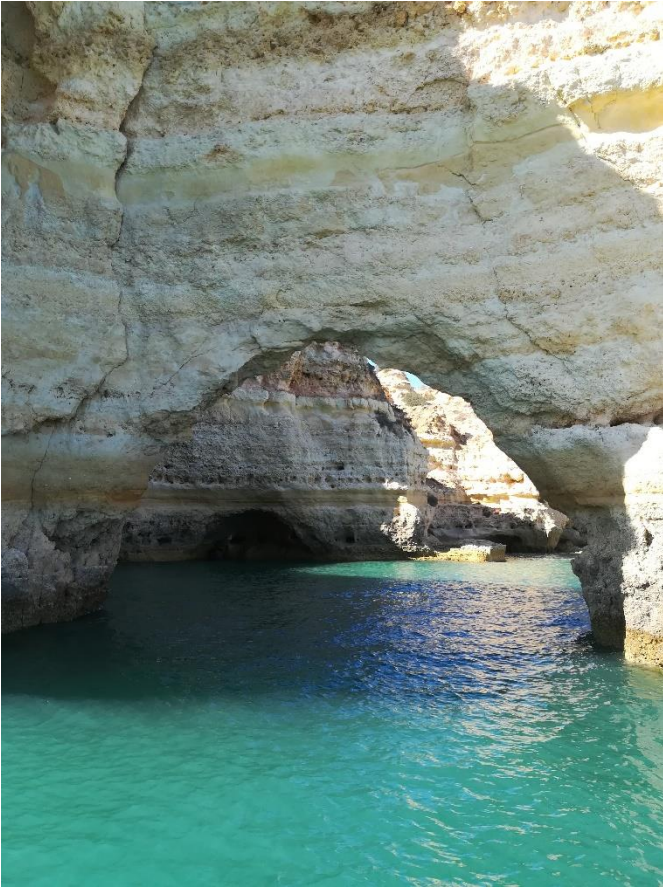
Benagil caves túra Albufeirából