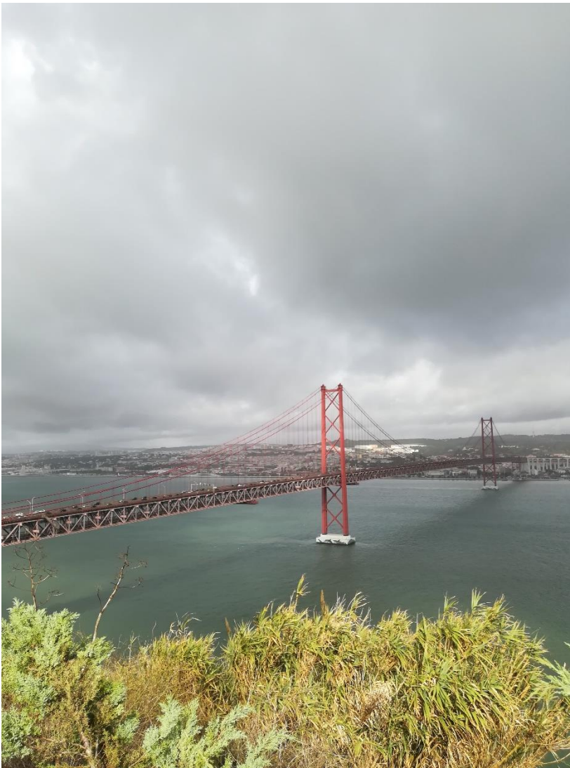
Április 25-e híd