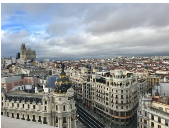
Gran Vía, Madrid egyik legforgalmasabb utcája a Szépművészeti Múzeum teraszáról fotózva