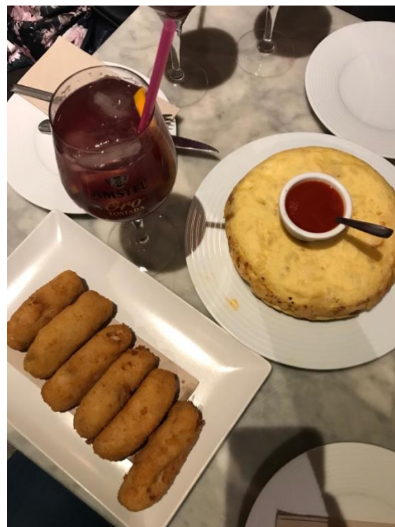
Sonkás krockett és spanyol omlett ott, ahol a legfinomabb: az El Búho étteremben