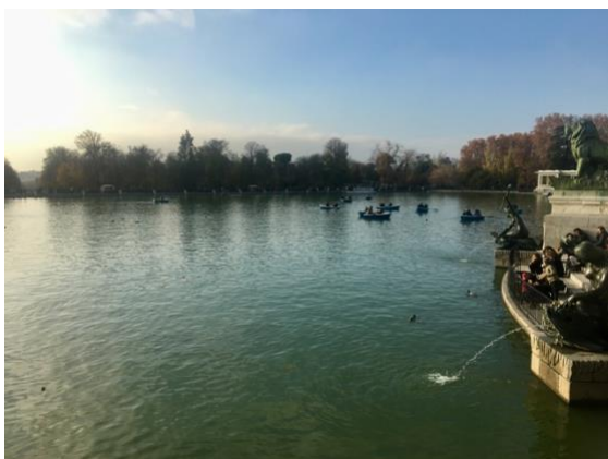
Parque de el Retiro, ahol csónakázni is lehet