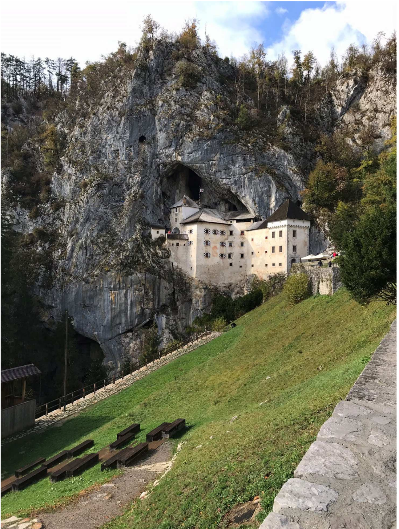
2 Predjama vár, egy órányira Ljubljanától