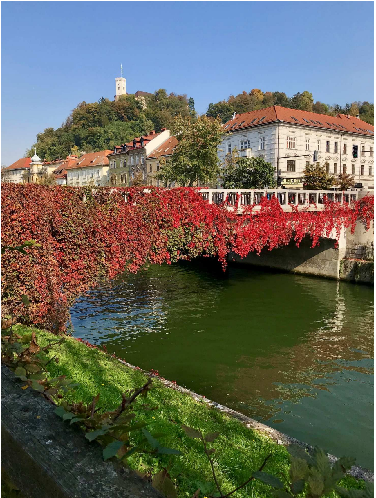
3 Ljubljana belvárosa