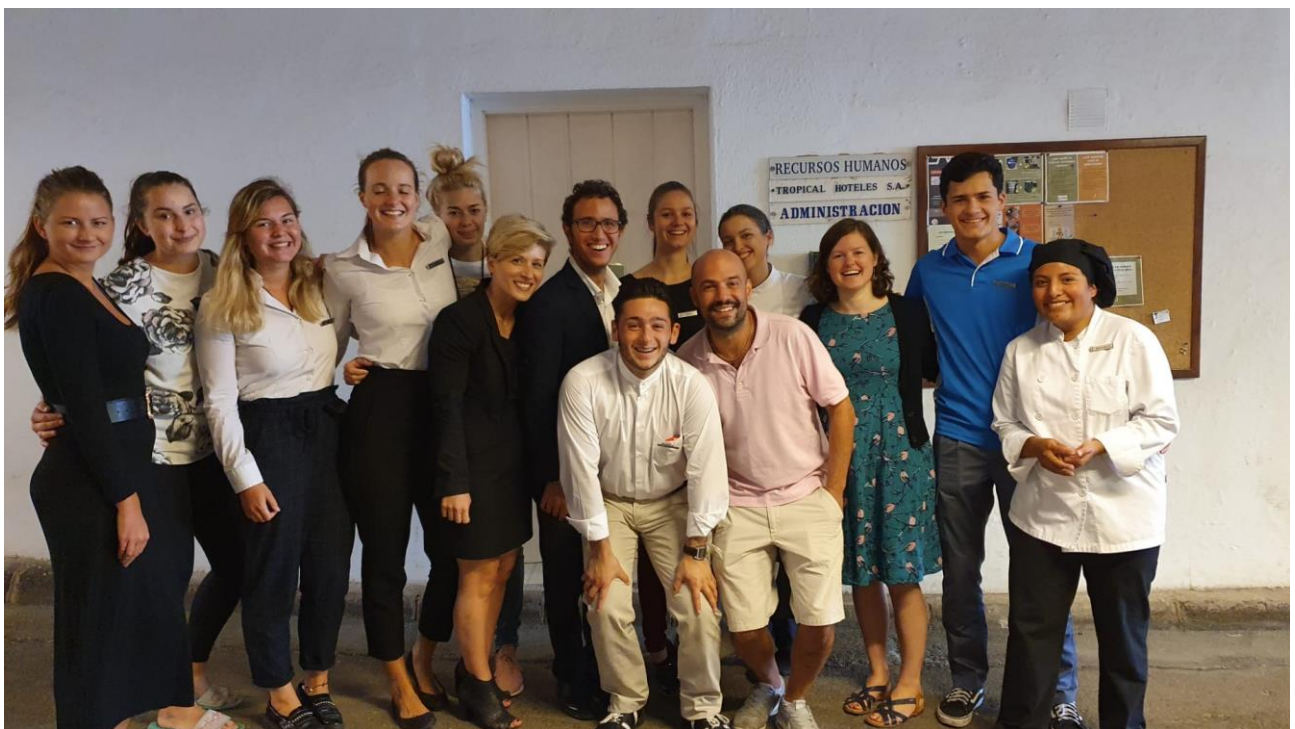
A Jardin Tropical Hotel gyakornokai