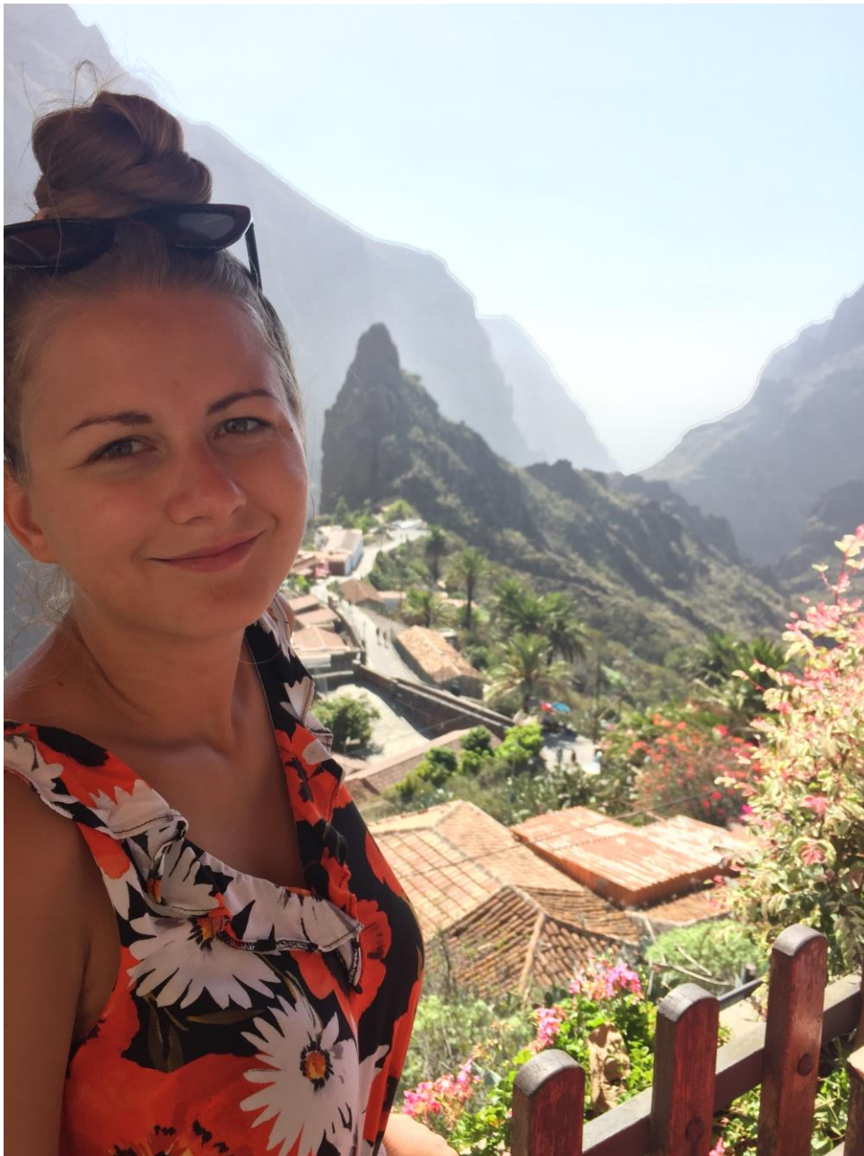
Hétfégy kirándulás Mascába