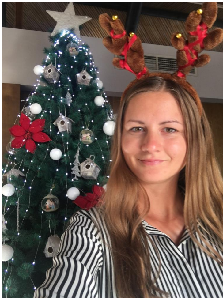
Karácsonyozás 30 C-ban, napbarnítottan