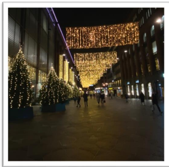
Oodi könyvtár (balra) és Helsinki karácsonyi kivilágításban (jobbra)