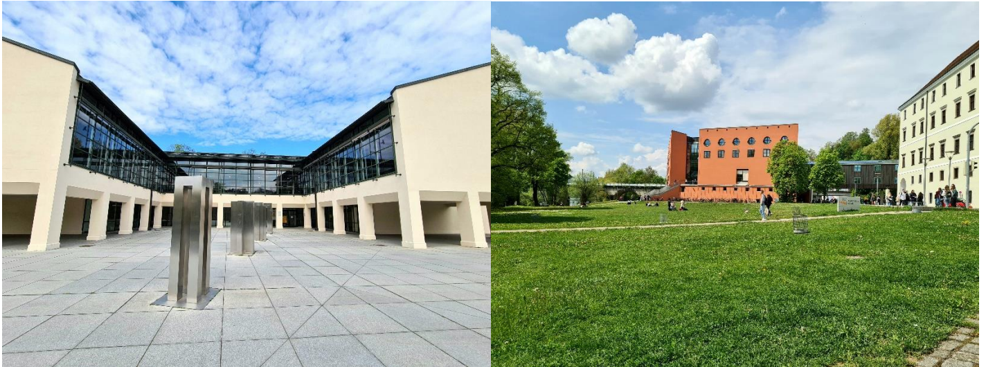
Egyetem néhány épülete: balra a központi könyvtár, jobbra az Innwiese-vel és a filozófiai épülettel