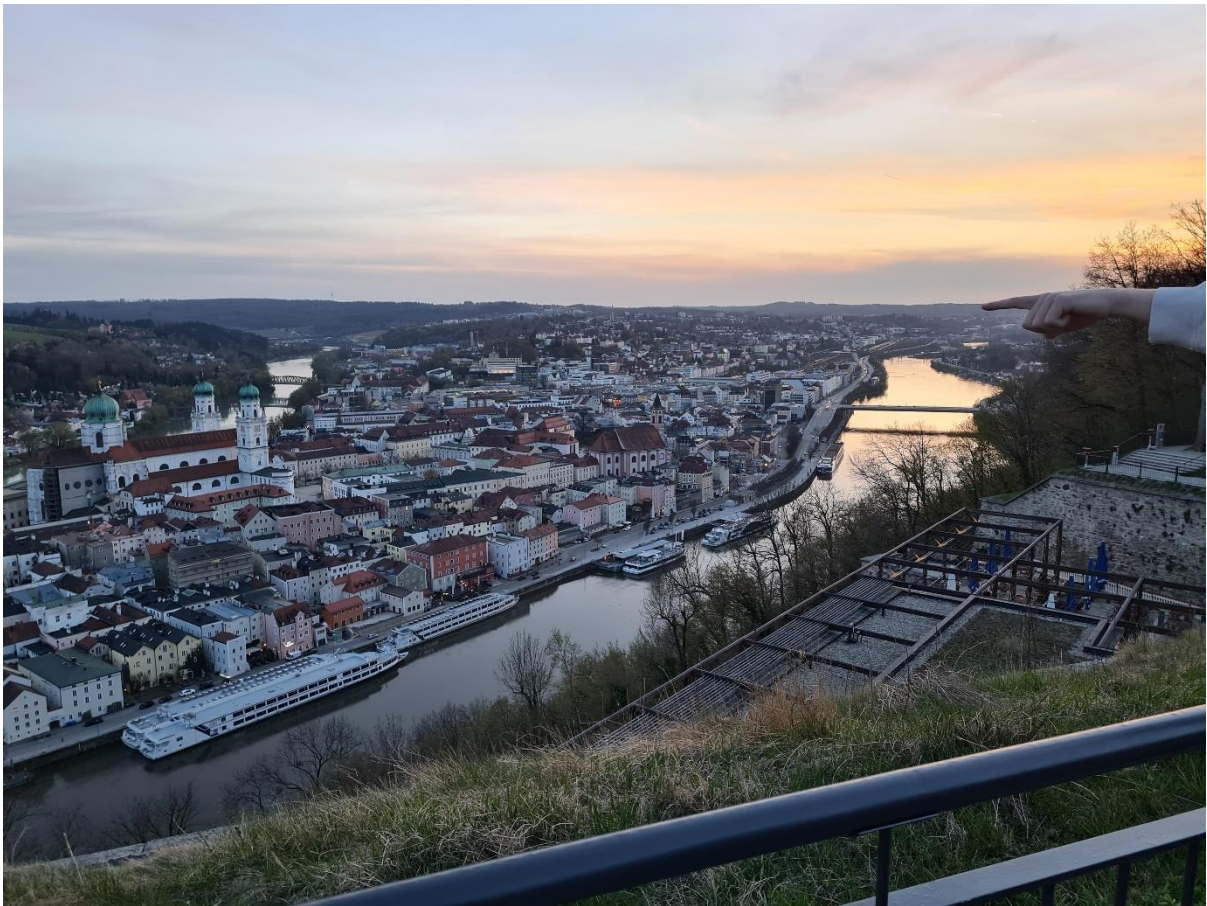
Kilátás naplementében a Veste Oberhaus-ból