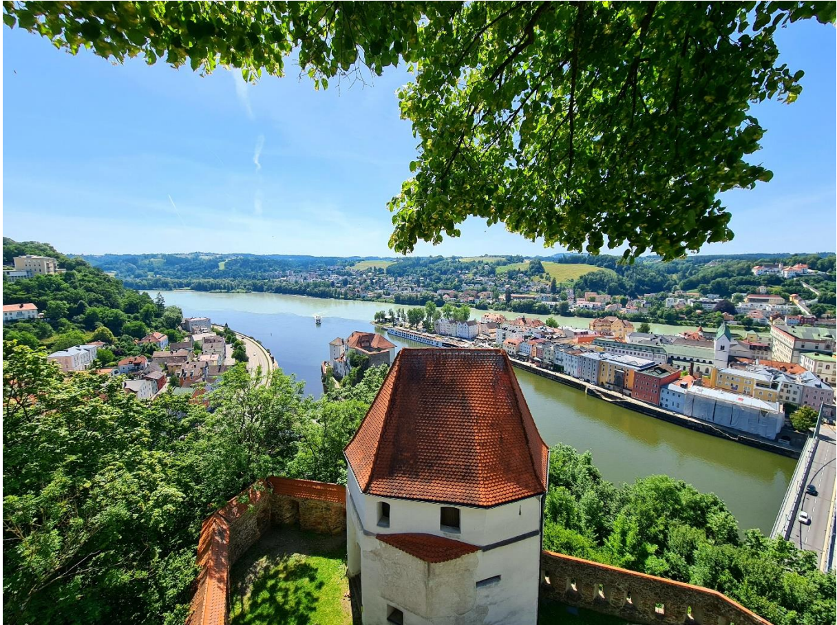
Kilátás a 3 folyó összefolyására, a kép jobb oldalán a dombon a Mariahilf látható