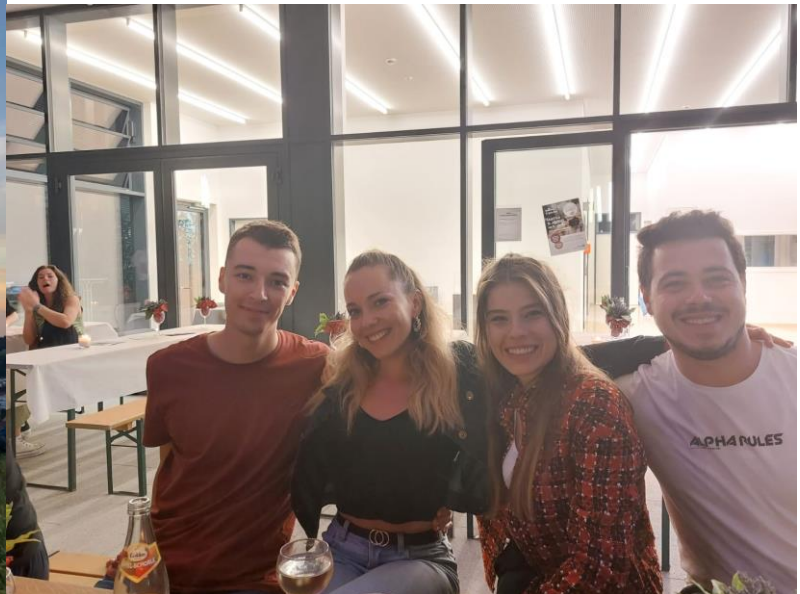
Barátok, kirándulások, csoportképek