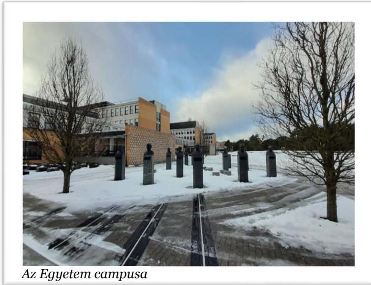
Az Egyetem campusa

voltak, de általánosságban nem akadt gondom a jegyszerzéssel, minimális energiabefektetéssel az egyes jegy simán megszerezhető.