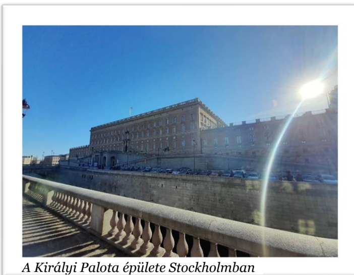
A Királyi Palota épülete Stockholmban

A Baltikumon és Oroszországon kívül itt van továbbá Skandinávia: Svédország, Dánia és Norvégia drágasága sok embert elriaszt, de mikor utazzon valaki, ha nem ilyenkor? Tény, hogy a tallinni reptér aprónak számít, és viszonylag kevés a közvetlen járat (például Budapestre sincs), de a nyári hónapokban jellemzően