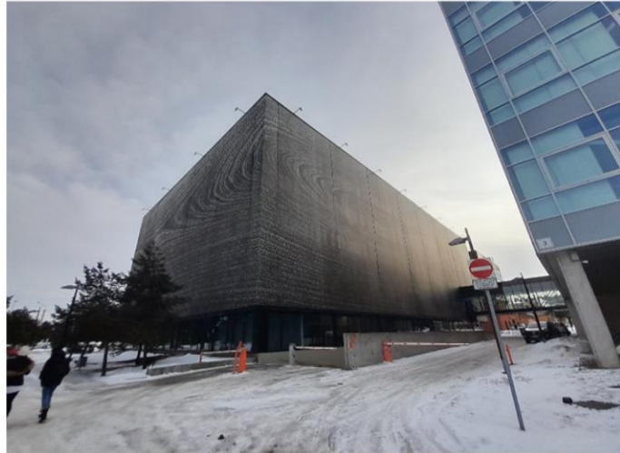
A könyvtár épülete – jobbra a Business School látszik

könyvtár is tele van egyéni tanulószobákkal, ahol elvonulva végezheti az ember dolgait. (Ezeket is ingyen le lehet foglalni.) A könyvtár hatalmas, 4 emeleten terül el, egy önálló épülete van. Több ezer kötet vár arra, hogy valaki kézbe vegye, és az egyetem profiljára jellemző módon minden terület képviselteti