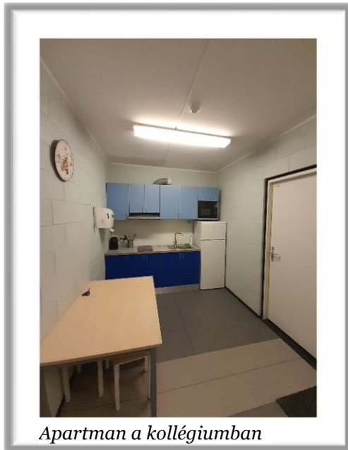
Apartment in a dormitory