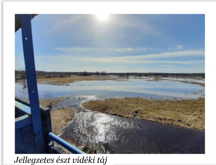
Jellegzetes észti vidéki táj