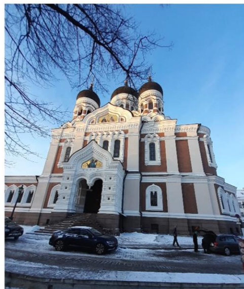
Tallinn fő nevezetessége, az Alekszandr Nyevszkij-katedrális

Keletről a nagy testvér, Oroszország határolja az 1,3 milliós államot, amely lakosságának jelentős részét (mintegy 25%-át) oroszok teszik ki. Tallinnban is hallani orosz szavakat, ha viszont az ember keletre utazik (pl. Narvába), akkor már az észtritkaságszámba megy. A szocializmus lenyomata tetten érhető az emberek gondolkodásában, az építészetben, az emberi kapcsolatokban , meg úgy mindenben. Délen Lettországgal békés